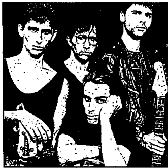
LES THUGS. PHOTO DENIS DAILLEUX