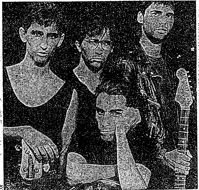
Les Thugs: «Aucun slogan, se méfient des certitudes»

Appeler un quatrième album Still Hungry , Still Angry rassure énormément sur les motivations d'un groupe. Les angevins Thugs (les Thugs, pas the Thugs, ils y tiennent) ont conservé intacte cette rage qui les habite depuis leurs débuts en avril 1983. Une ligne de conduite face à un business toujours plus pressant. Sur scène, forts de l'expérience de centaines de concerts de par le monde, les Thugs commencent forcément à contrôler leur affaire: l'émotion. Surtout au travers de la voix, qui sait se faire bravement mélancolique.